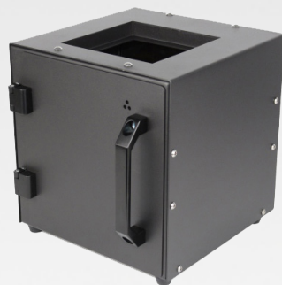
Caisson four UV

Cet appareil peut être utilisé avec le Pavé LED PRECI-CURE